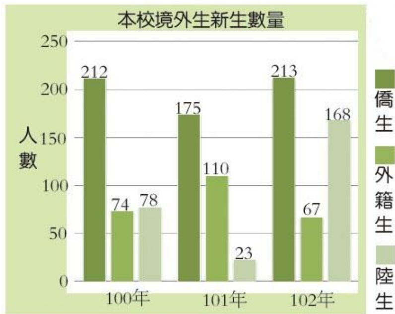
本校境外生新生數量 (表/境外生輔導組提供)