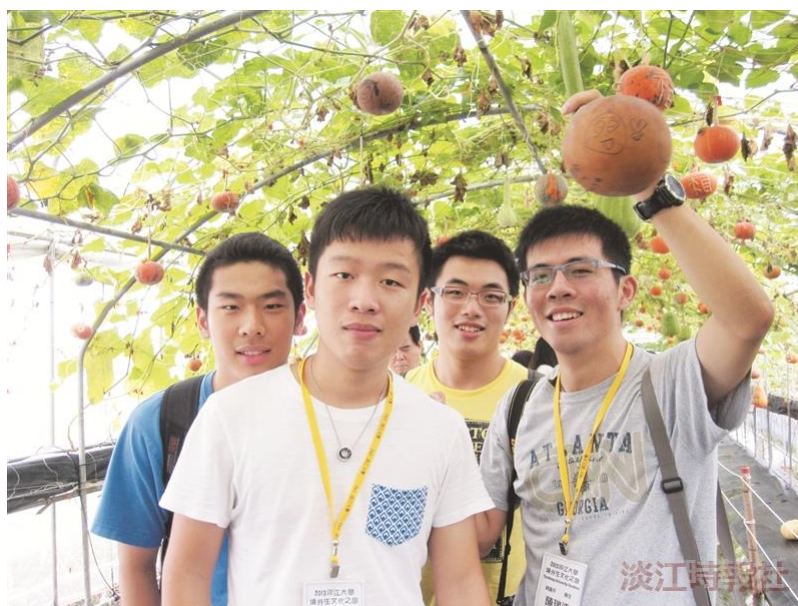
境外生遊壯園南瓜園。